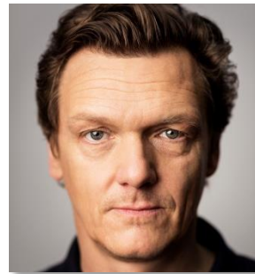
Dr. Thomas Oberender Intendant Berliner Festspiele

„Wir wollen Künstlerinnen und Künstlern, die an den nordrhein-westfälischen Hochschulen ausgebildet werden, attraktive Arbeits- und Lebensbedingungen bieten. Für nationale und internationale Kulturschaffende soll der Anreiz hoch sein, sich in einer künftigen Künstler-Metropole Ruhr mit ihren reizvollen und herausfordernden Möglichkeiten anzusiedeln. Thomas Oberender ist als Intendant der Berliner Festspiele und durch seine Stationen an der Ruhr-Universität Bochum, beim Schauspielhaus Bochum, bei der Ruhrtriennale und bei der Kulturhauptstadt Ruhr 2010 mit ganz unterschiedlichen Kunstsparten vertraut und überdies ein exzellenter Kenner der Kulturlandschaft im Ruhrgebiet. Er wird der Kulturszene Ruhr spannende neue Impulse geben.“