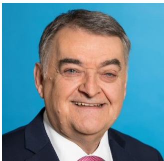
Minister Herbert Reul