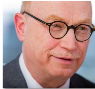
Prof. Martin Stratmann Präsident Max-Planck-Gesellschaft

„Die Hochschulen im Ruhrgebiet bieten das gesamte Spektrum hochschulischer Ausbildung und das auf relativ kleinem Raum. Dazu kommen die zahlreichen Institute innerhalb und außerhalb der Universitäten des Ruhrgebiets, die ebenso wie die Hochschulen für angewandte Wissenschaft noch stärker als Impulsgeber für die Entwicklung wirtschaftlicher Innovation im Ruhrgebiet vernetzt werden können. Prof. Dr. Martin Stratmann, Präsident der Max-Planck-Gesellschaft, ist als Hochschullehrer, vielfach ausgezeichnete Forscher und als herausragender Wissenschaftsmanager ein Experte für die Kooperation von Forschungsinstituten mit Hochschulen und dem Transfer von Know-how in die Gesellschaft. Es ist ein Glücksfall, dass er sich dem Ruhrgebiet durch seinen Lebensweg so eng verbunden fühlt. Für mich wird er ein idealer Partner in diesem Prozess sein.“