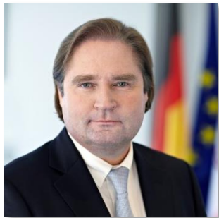
Minister Lutz Lienenkämper

„Innovationen sind ein Schlüsselfaktor für Wachstum und Beschäftigung, auch im Ruhrgebiet. Die Landesregierung und die NRW.BANK setzen gemeinsam mit privaten Partnern mit dem „Gründerfonds Ruhr“ gezielt Akzente, um innovative Start-ups etwa in den Segmenten Digitalisierung, Medizintechnik oder Energie zu fördern. Wir wollen Start-up-Region Nummer eins in Deutschland werden.“