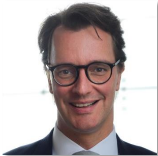
Minister Hendrik Wüst

„Für die vielen Pendler entlang der Ruhr braucht es neue Ansätze, um ihre Mobilitätsbedürfnisse auch in Zukunft bedienen zu können. Das Ruhrgebiet bietet mit seiner hohen Bevölkerungsdichte beste Voraussetzungen für einen Ausbau innovativer Mobilitätsangebote, die die verschiedenen Verkehrsträger stärker vernetzen. In der Ruhr-Konferenz wollen wir gemeinsam mit den Kommunen an neuen bedarfsgerechten Mobilitätsangeboten arbeiten.“