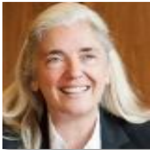
Ministerin Isabel Pfeiffer-Poensgen

„Wir wollen Künstlerinnen und Künstlern, die an den nordrhein-westfälischen Hochschulen ausgebildet werden, attraktive Arbeits- und Lebensbedingungen bieten. Für nationale und internationale Kulturschaffende soll der Anreiz hoch sein, sich in einer künftigen Künstler-Metropole Ruhr mit ihren reizvollen und herausfordernden Möglichkeiten anzusiedeln. Thomas Oberender ist als Intendant der Berliner Festspiele und durch seine Stationen an der Ruhr-Universität Bochum, beim Schauspielhaus Bochum, bei der Ruhrtriennale und bei der Kulturhauptstadt Ruhr 2010 mit ganz unterschiedlichen Kunstsparten vertraut und überdies ein exzellenter Kenner der Kulturlandschaft im Ruhrgebiet. Er wird der Kulturszene Ruhr spannende neue Impulse geben.“