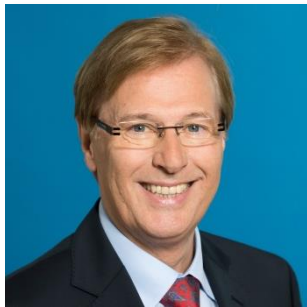
Minister Peter Biesenbach