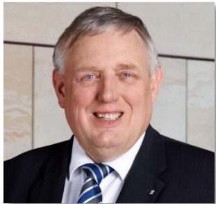
Minister Karl-Josef Laumann