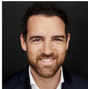
Christoph Metzelder Ehemaliger Fußballnationalspieler