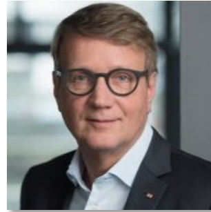
Ronald Pofalla Vorstandsmitglied Deutsche Bahn AG

„Für die vielen Pendler entlang der Ruhr braucht es neue Ansätze, um ihre Mobilitätsbedürfnisse auch in Zukunft bedienen zu können. Das Ruhrgebiet bietet mit seiner hohen Bevölkerungsdichte beste Voraussetzungen für einen Ausbau innovativer Mobilitätsangebote, die die verschiedenen Verkehrsträger stärker vernetzen. In der Ruhr-Konferenz wollen wir gemeinsam mit den Kommunen an neuen bedarfsgerechten Mobilitätsangeboten arbeiten.“