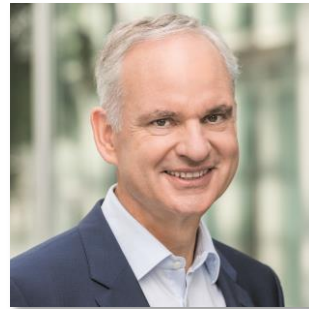
Dr. Johannes Teysen Vorstandsvorsitzender E.ON

„Mit der Digitalisierung durchläuft die Metropolregion Ruhr einen erneuten grundlegenden Wandel. Dieser durchdringt alle Lebens- und Wirtschaftsbereiche und eröffnet der Region die Chance, neue Potentiale zu erschließen und noch bestehende Schwächen in Stärken zu verwandeln. Dazu gehört der für die Ruhrregion besonders wichtige Energiesektor, der sich im Zuge der Energiewende neu erfinden muss und dazu in der Digitalisierung geeignete Werkzeuge einer zunehmend dezentralen, intelligenten Energieversorgung findet. Hier freue ich mich auf die Zusammenarbeit mit Dr. Johannes Teysen, einem der führenden Köpfe und mutigen Erneuerer der europäischen Energiewirtschaft.“