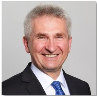
Minister Prof. Dr. Andreas Pinkwart