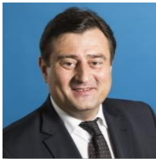
Staatssekretär Mathias Richter

„Die Landesregierung ist mit dem Ziel angetreten, Schülerinnen und Schülern beste Bildungschancen zu eröffnen. Dabei soll unter anderem der Schulversuch ‚Talentschulen‘ helfen, der ab dem Schuljahr 2019/20 starten wird. An bis zu 60 Schulen in einem schwierigen sozialen Umfeld werden wir erproben, wie Schülerleistungen durch zusätzliche personelle Ressourcen und besondere Unterrichtskonzepte verbessert werden können. Auf diese Weise wollen wir Kindern und Jugendlichen neue Aufstiegschancen bieten und soziale Nachteile überwinden.“