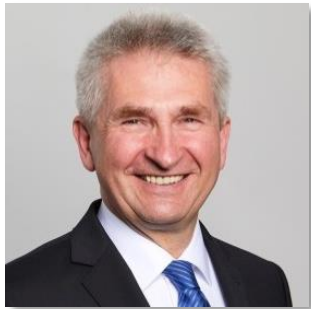
Minister Prof. Dr. Andreas Pinkwart

„Mit der Digitalisierung durchläuft die Metropolregion Ruhr einen erneuten grundlegenden Wandel. Dieser durchdringt alle Lebens- und Wirtschaftsbereiche und eröffnet der Region die Chance, neue Potentiale zu erschließen und noch bestehende Schwächen in Stärken zu verwandeln. Dazu gehört der für die Ruhrregion besonders wichtige Energiesektor, der sich im Zuge der Energiewende neu erfinden muss und dazu in der Digitalisierung geeignete Werkzeuge einer zunehmend dezentralen, intelligenten Energieversorgung findet. Hier freue ich mich auf die Zusammenarbeit mit Dr. Johannes Teysen, einem der führenden Köpfe und mutigen Erneuerer der europäischen Energiewirtschaft.“