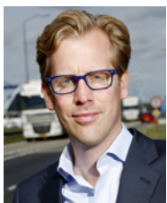
Christophe van der Maat Regionalminister Mobilität und Zusammenarbeit der Provinz Noord-Brabant Gedeputeerde Mobiliteit en Samenwerking - Provincie Noord-Brabant