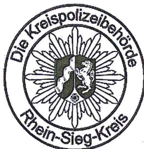
Muster 6: Dienstsiegel für Landrätinnen und Landräte als Kreispolizeibehörde

b) Das Muster 6 wird durch folgendes Muster 6 ersetzt: