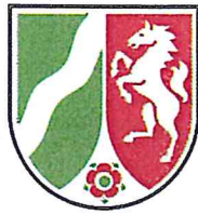
Muster 1a: Landeswappen Nordrhein-Westfalen in vereinfachter Form

c) Nach Muster 6 werden die folgenden Muster 6a bis 6c eingefügt: