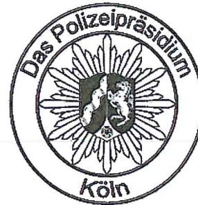
Muster 6a: Dienstsiegel für Polizeipräsidien