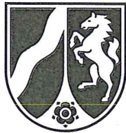
Muster 1b: Landeswappen Nordrhein-Westfalen in vereinfachter Form (schwarz-weiß)