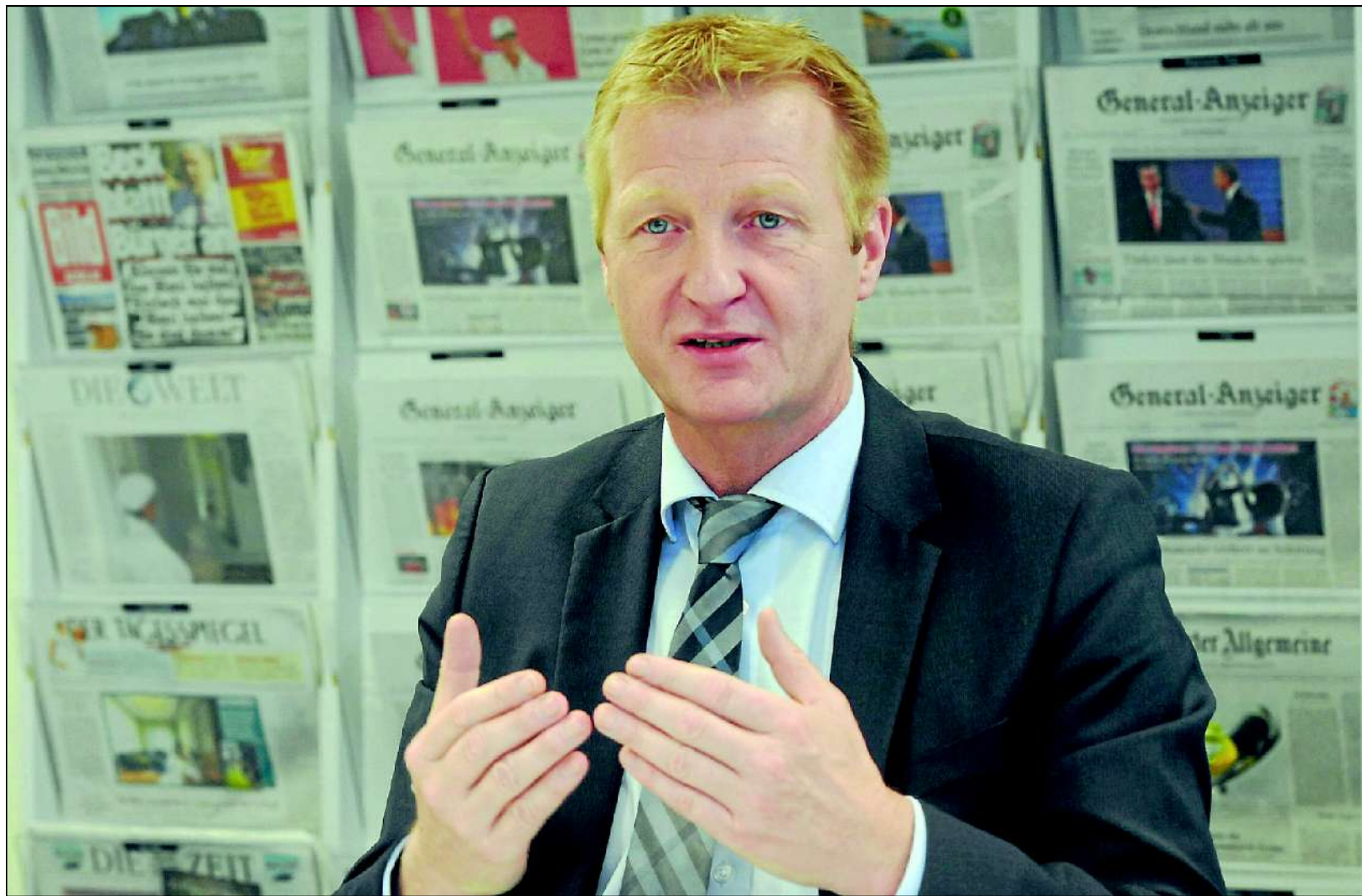
„Die Ausstattung und die Bezahlung der NRW-Polizei sind spitze“, sagt Innenminister Ralf Jäger beim Redaktionsbesuch.